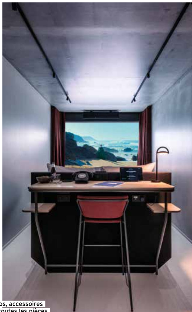
Affiches, photos, accessoires évoquent dans toutes les pièces les belles heures du cinéma et ses protagonistes.