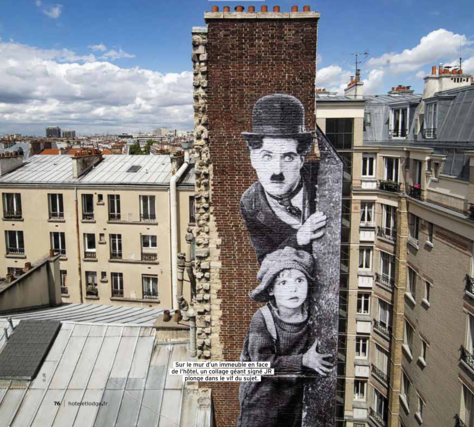
Sur le mur d'un immeuble en face de l'hôtel, un collage géant signé JR plonge dans le vif du sujet.